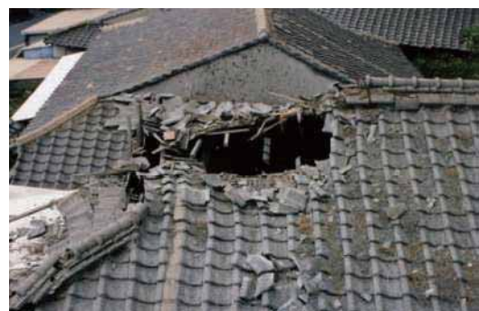
噴火で噴出した噴石で穴が開いた瓦屋根