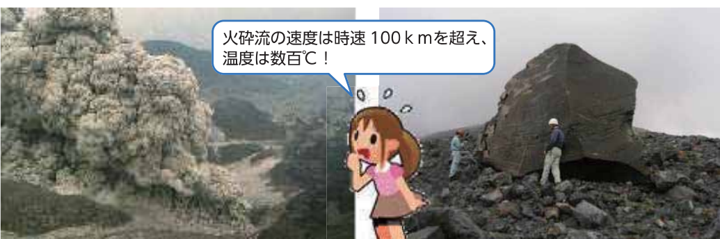
山体を急速に流下する火砕流

火山の噴火に気がついたとき、噴火速報が発表されたときは、直ちに身の安全を図りましょう。迷っている時間はありません。