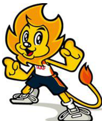
日本陸上競技連盟公式マスコット “アスリオン”